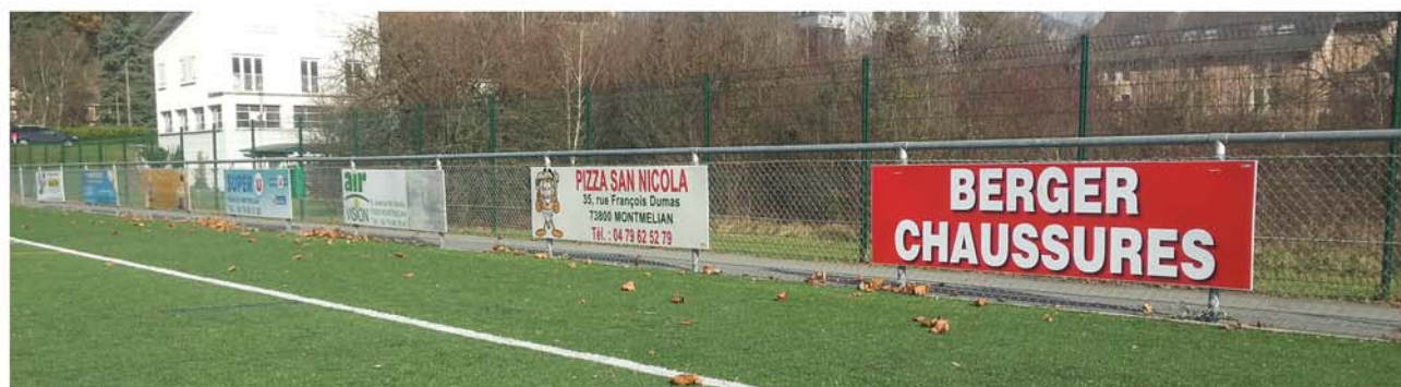
Panneaux publicitaires du Stade de l'Île (terrain synthétique)