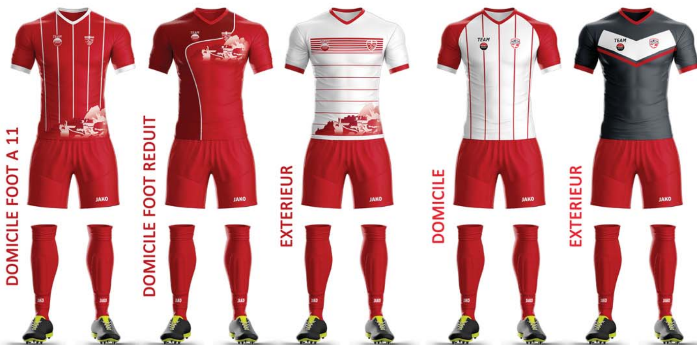
Jeux de maillots Montmélian AF U7 - U9 - U11 - SEN - FEM - VET